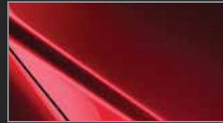
Soul Red M