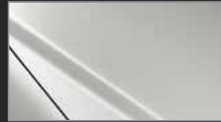
Crystal White Pearl