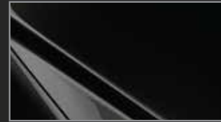
Jet Black MC