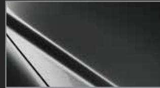
Meteor Gray MC