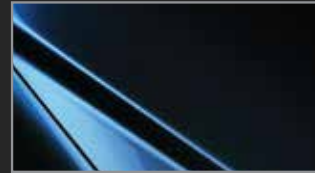
Deep Crystal Blue MC