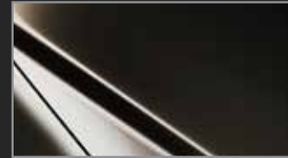
Titanium Flash MC