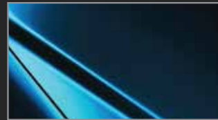
Dynamic Blue MC